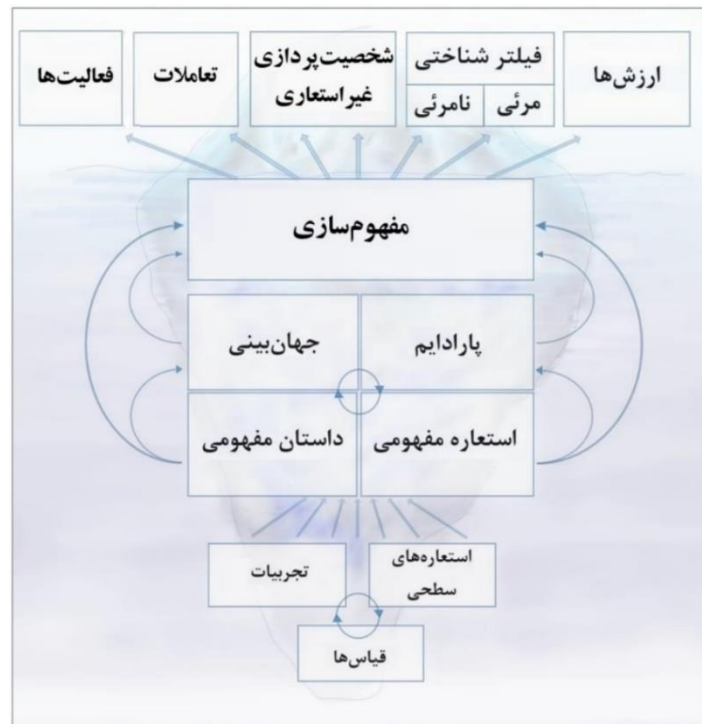
شکل ۱) چارچوب کوه یخ برای تحلیل مفهومی (Donaldson & Allen-Handy, 2020, p. 3)

زیگموند فروید ۱ ساختار ذهن انسان را شامل سه بخش هوشیار، نیمه‌هوشیار و ناهوشیار می‌دانست. او ذهن انسان را به کوهی از یخ که در اقیانوس شناور است تشبیه می‌کرد. بخشی کوچک از این کوه یخ، بیرون آب و بخش بزرگ‌تر آن در زیر آب پنهان است. فروید باور داشت ساختار ذهنی ما نیز همانند کوه یخ است و ما نسبت به بخشی بزرگ از ذهنمان ناآگاه هستیم. چارچوب کوه یخ به منظور تحلیل مفهوم‌سازی در سال ۲۰۲۰ توسط دونالدسون و آلن هندی ۲ ارائه شده است. آن‌ها پژوهشی با عنوان ماهیت و قدرت مفهوم‌سازی یادگیری انجام دادند که در آن، با استفاده از چارچوب کوه یخ دو مفهوم‌سازی متمایز یادگیری (مفهوم‌سازی انتقال/اکتساب دانش و مفهوم‌سازی سازه یادگیری) ارائه شده‌اند. در چارچوب کوه یخ، قیاس‌ها، استعاره‌های سطحی، استعاره‌های مفهومی، پارادایم‌ها و جهان‌بینی‌ها به شکل‌گیری مفهوم‌سازی کمک می‌کنند. چارچوب کوه یخ بر رابطه بین مفهوم‌سازی در زیر سطح آگاهی و پدیده‌های قابل مشاهده در بالای سطح آگاهی تأکید می‌کند. در شکل ۱، چارچوب مفهوم‌سازی کوه یخ ارائه شده است. با استفاده از مبانی نظری ارائه‌شده توسط فروید، می‌توان نتیجه گرفت ارزش‌ها، فیلتر شناختی، شخصیت‌پردازی غیراستعاری، تعاملات، فعالیت‌ها، غیراستعاری، تعاملات و فعالیت‌ها در قسمت آشکار قرار می‌گیرند؛ استعاره مفهومی، داستان مفهومی، پارادایم و جهان‌بینی در قسمت نیمه‌آشکار قرار می‌گیرند و قیاس‌ها، استعاره‌های سطحی و تجربیات در بخش ناآشکار قرار می‌گیرند.